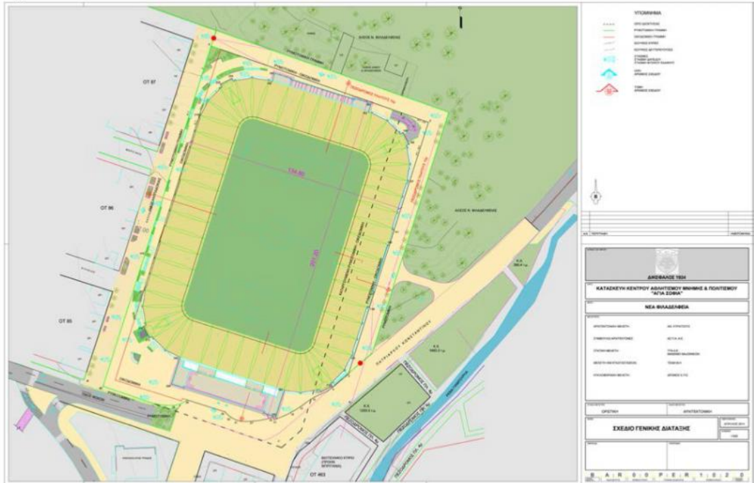
γήπεδο και περιβάλλον χώρος (Master Plan Γενικής Διάταξης ΚΕΦ. 6 ΣΕΛ. 2 )

εισητηρίων και σωματικός έλεγχος, ζώνη 3: περιμετρική ζώνη κυκλοφορίας, συνεύρεσης, κυλικείων), τη διαφυγή σε περιπτώσεις έκτακτης ανάγκης ή πανικού (επεισόδια, ατύχημα, πυρκαγιά, σεισμός κλπ), την περιμετρική κίνηση καθώς και τη μετακίνηση θεατών από θύρα σε θύρα, κατά την αναζήτηση εισόδου. Ωστόσο στην περίπτωση του συγκεκριμένου γηπέδου οι ζώνες αυτές δεν μπορούν να αναπτυχθούν.